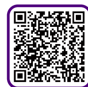
扫一扫 了解更多产品信息