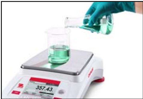
称量应用功能丰富