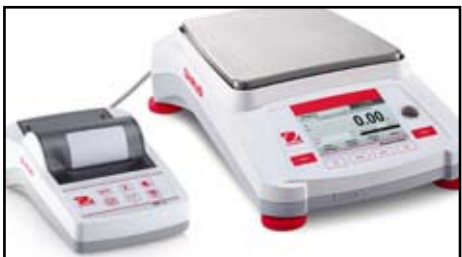
方便连接打印机等外围设备