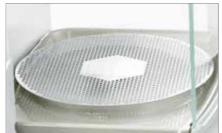
130 mm 滤膜称盘