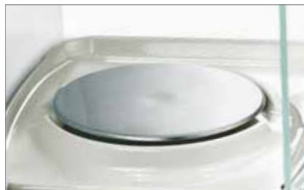
90 mm 称盘，包括转换套件