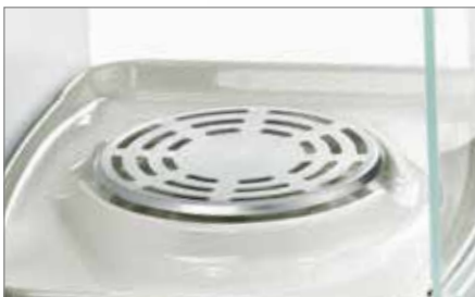
80 mm 称盘，提高称量性能